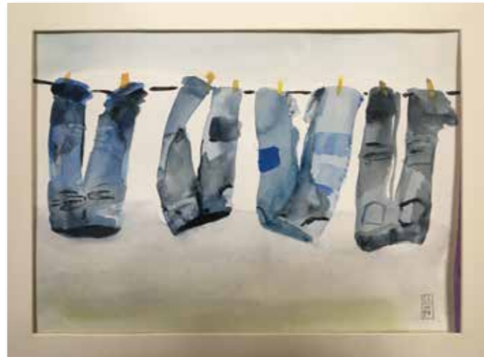
Lieblingsthema: Der Alltag bekommt in Silkes Bildern einen feinen Touch.

Die Aquarellmalerei ist eine zarte Form der Malerei. Die einzigartigen Eigenschaften der Aquarellfarben kommen ganz besonders bei den von Silke in der Nass-in-Nass-Technik gemalten Bildern zum Ausdruck. Auch wenn einige Bilder etwas farbschwach scheinen, so haben sie dennoch eine starke Aussagekraft. Andere Bilder sind stellenweise präzise