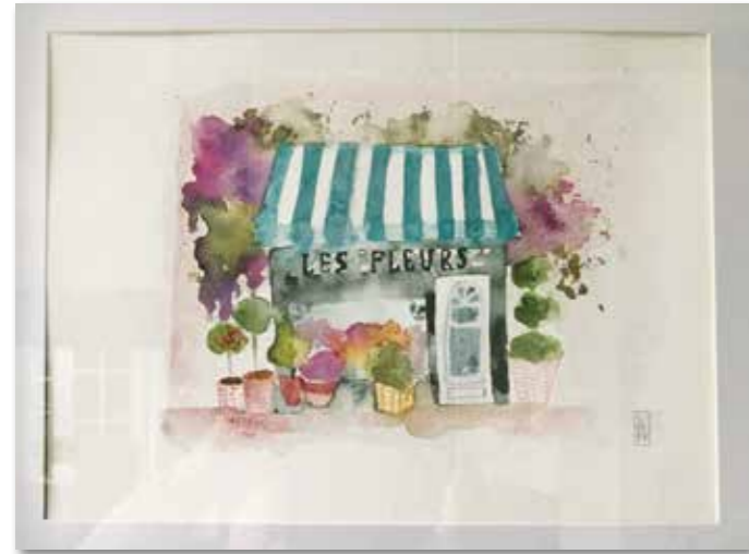
Lieblingsthemat: Blumen, Pflanzen, Natur und Architektur.

wurde aber erst Jahrhunderte später durch William Turner wieder erreicht, der uns als einer der wohl bedeutendsten Aquarellisten bekannt ist.