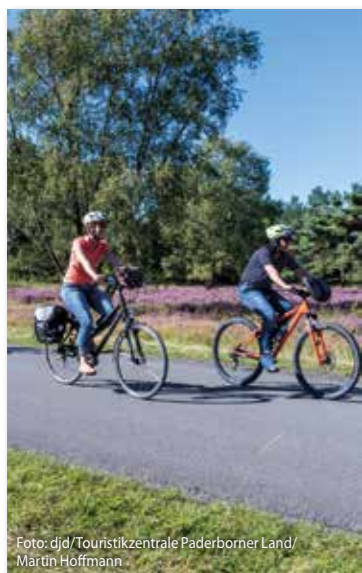
Die Route führt Radler durch das Heidegebiet Senne mit den Emsquellen.

der Landesgartenschau spazieren und anschließend in der Westfalen Therme relaxen. Ein großer Vorteil ist, dass die Paderborner Land Route größtenteils autofrei über separate Radwege und naturnahe Wegabschnitte verläuft. Unterwegs finden Radler genügend Möglichkeiten zum Einkehren und Übernachten – Informationen sowie Etappenbeschreibungen gibt es im Netz unter www.paderborner-land-route.de . Gemütliche Restaurants, Cafés und Ausflugslokale servieren regionale Spezialitäten wie Paderborner Landbrot, westfälischen Knochenschinken und Bier, Spargel, Erdbeeren oder Wild.