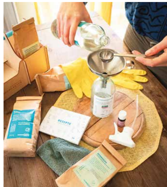
Mit den richtigen Rezepten, Hausmitteln und Messutensilien lassen sich nachhaltige Haushaltsreiniger einfach zubereiten.