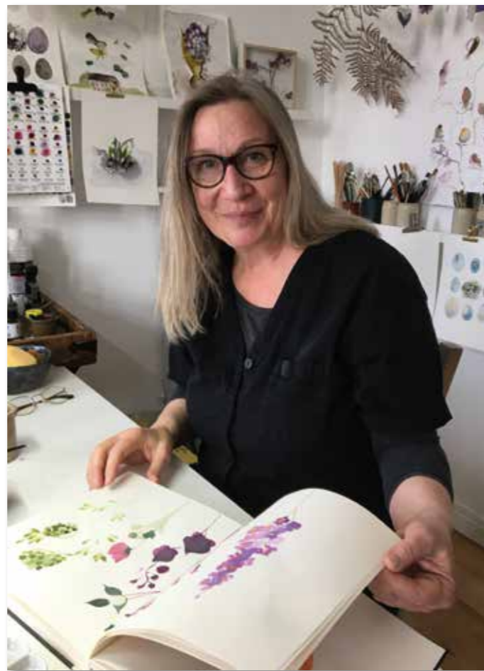
Lieblingsplatz: im Atelier mit Skizzenbuch, Stiften und Farben.