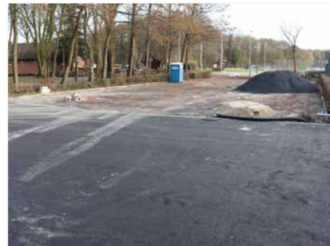
Der Parkplatz am Wiebusch wurde jüngst saniert.