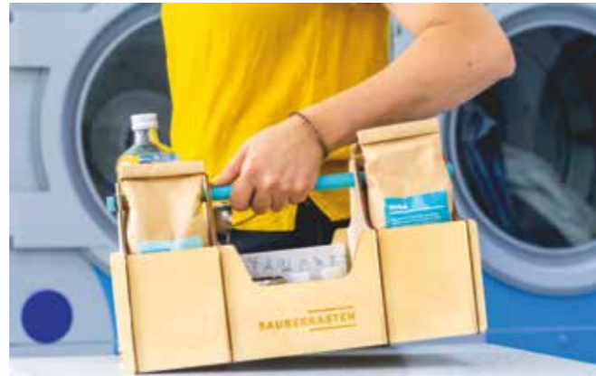
Im tragbaren Kasten ist alles enthalten, was man zur Herstellung der meisten Reinigungsmittel braucht.

Grund genug, beim Putzen für mehr Nachhaltigkeit zu achten. Sucht man nach unbedenklichen Alternativen, landet man schnell bei altbewährten Hausmitteln, etwa Natron, Kernseife, Essig und mehr. Damit lassen sich im Do-It-Yourself-Verfahren zu Hause wirksame und zu-