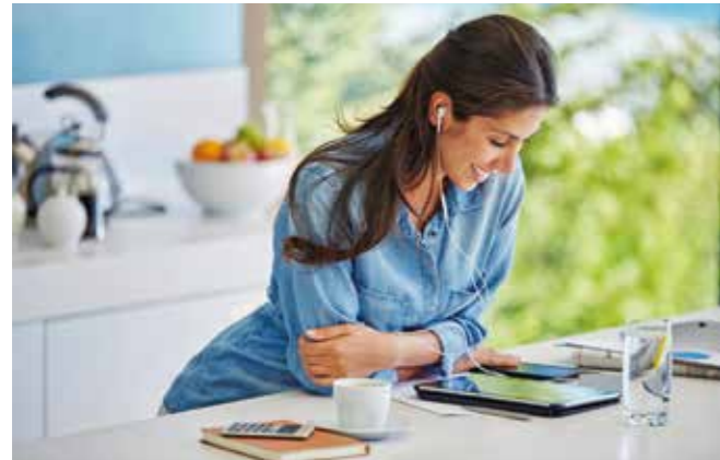
Stilles Wasser ist nur am Morgen gefragt. Ansonsten bevorzugen die in Deutschland Befragten die sprudelnde Variante.

(djd). Zu viel, zu spät, am liebsten Sprudel: Eine internationale Umfrage mit 2.750 Teilnehmern in Europa, den USA, Kanada und Australien fördert Besonderheiten beim Wasserverbrauch in Deutschland zutage. So trinken etwa 39 Prozent der Befragten hierzulande erst, wenn sie tatsächlich Durst empfinden. Spanier und Italiener zum Beispiel