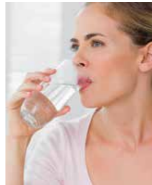
Das Trinken nicht vergessen. 39 Prozent der Befragten hierzulande greifen erst zum Wasserglas, wenn sie bereits Durst verspüren.

Mit 59 Prozent greift die Mehrheit in Deutschland zu Hause mit Vorliebe zu Einweg-Plastikflaschen, unterwegs sind es sogar zwei Drittel. Übertroffen wird dies noch von Italien (66 Prozent), den USA (67 Prozent) und Spanien (68 Prozent). Leitungswasser trinken nur 36 Prozent der Deutschen, um Plastikflaschen zu vermeiden. Dabei zählt das Trinkwasser aus den öffentlichen Netzen zu den am strengsten kontrollierten Lebensmitteln. Tischwasserfilter etwa von ZeroWater bereiten es