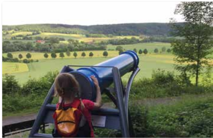
Auf dem knapp sechs Kilometer langen Kaleidoskopweg laden acht Riesen-Kaleidoskope dazu ein, mit Licht und Glas zu spielen.

der heimischen Karstlandschaft kennenlernen. Die Tour führt von Dahl auf die Paderborner Hochfläche. Ein Stück verläuft sie dabei entlang des Skulpturenpfades, auf dem es sechs Kunstwerke aus Eichenholz, Stahl und Stein zu sehen gibt. Wer sich eher für Graffitikultur interessiert, kann in Paderborn an geführten Graffiti-Rundgängen oder einer multimedialen Graffiti-Tour teilnehmen. Weitere Tourentipps hält die interaktive Freizeitskarte „Teuto_Navigator“ unter www.teutonavigator.com bereit. Eine Übersicht zu den schönsten Zielen und Routen in der Region bietet zudem der „Wanderplaner Teutoburger Wald“, der unter www.teutoburgerwald.de/wanderregion kostenfrei bestellt oder heruntergeladen werden kann.