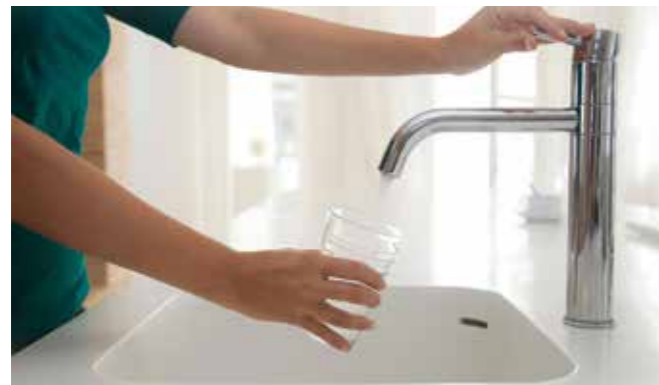
Das Wasser aus dem Hahn zählt zu den am besten und strengsten kontrollierten Lebensmitteln Deutschlands.

greifen viel früher zur Wasserflasche. Schließlich ist Durst ein Warnsignal des Körpers, bereits bei einem Flüssigkeitsmangel von zwei Prozent kann es zu Einbußen von Leistung, Konzentration und Reaktionsvermögen kommen. Das passiert besonders leicht bei Menschen, die weniger als die empfohlene Flüssigkeitsmenge von andert-