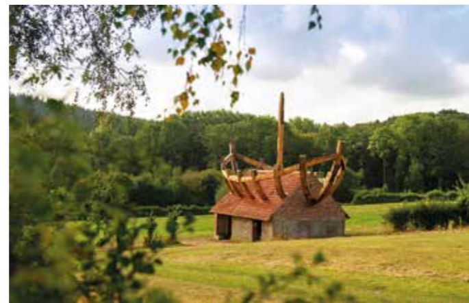
„Das Haus im Boot das Boot im Haus“ heißt die Großskulptur im Nieheimer Kunstpfad.

den Hermannshöhen, dürfen sich Wanderer wiederum nicht nur an spektakulären Landschaften erfreuen, sondern auch zwei besondere Reisebegleiter kennenlernen. An verschiedenen Hörstationen direkt am Weg kann man auf Hängematten und anderen Hörmöbeln Platz nehmen und lauschen, was Anna und ihr Opa Hermann zu berichten haben. Auf Knopfdruck erzählen