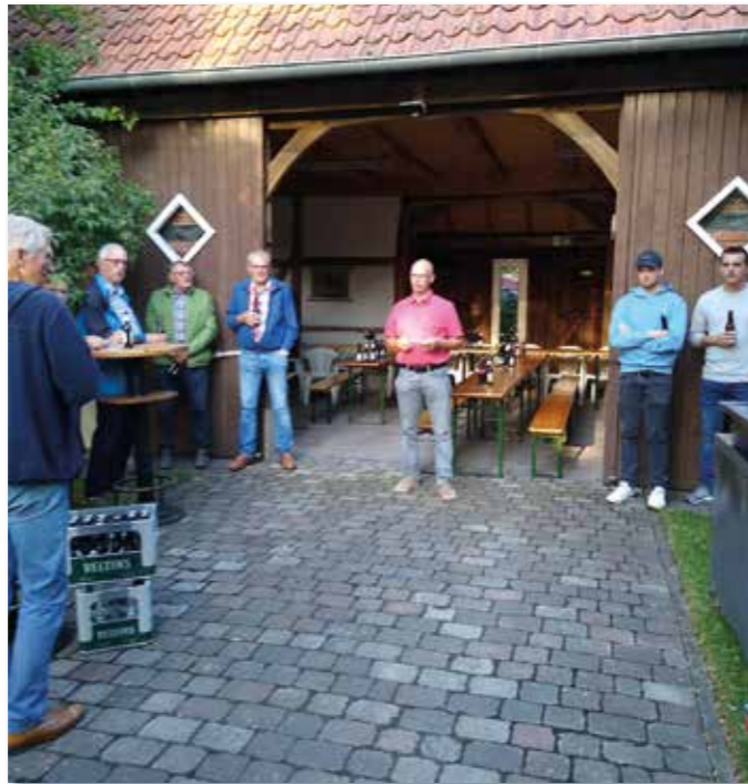
An der Fahrerversammlung nahmen 35 der 45 aktiven Fahrer teil.