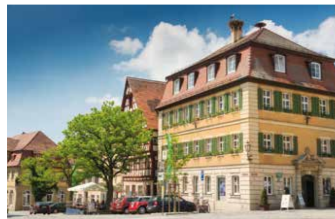
Das alte Rathaus mit Mansardwalmdach in Feuchtwangen ist ein Schmuckstück unter den Baudenkmalern.

Einkehrmöglichkeiten gibt es in Wehlmäusel und Bernau. Nach guten 15 Kilometern hat man seinen Ausgangspunkt wieder erreicht. Mit dem Rehweg und dem Fuchsweg gibt es jetzt auch zwei Rundwege im nördlichen Teil des Feuchtwanger Landes, das zum Naturpark Frankenhöhe gehört. Das sonnenreiche Gebiet weist ein ausgeglichenes Klima auf, in dem sich viele Pflanzen und Tiere wohlfühlen. In den naturbelassenen Randbuchten und Südhängen gedeihen unter anderem duftender Bergthymian, seltene Orchideen, Adonisröschen und Küchenschelle.