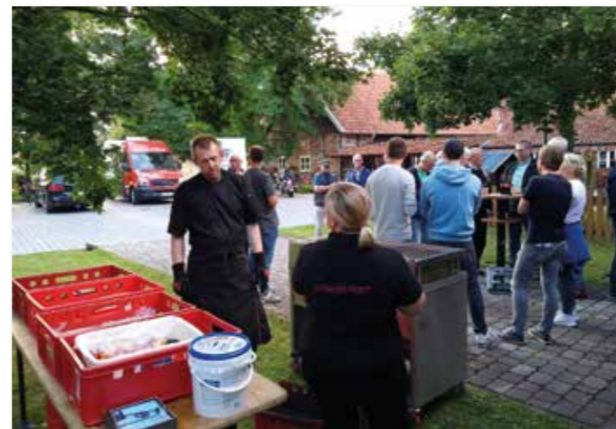
Grill- und Partyservice Bergen/Crabus sorgte mit Gegrilltem für das leibliche Wohl.

Aber der Bürgerbusverein hielt auch noch eine Überraschung an diesem Abend für seine Fahrer bereit. Da die Herbstzeit ansteht und die