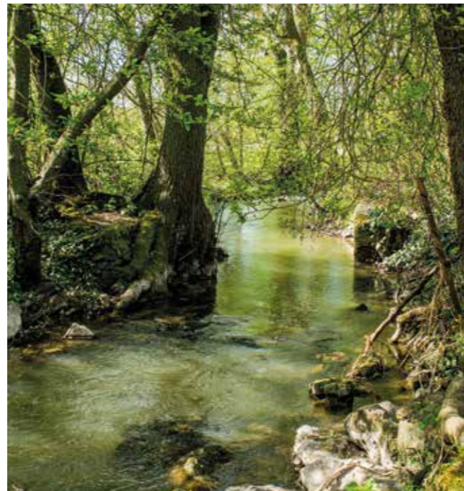
Das Feuchtwanger Land mit seinen idyllischen Bachläufen ist zum Wandern bestens geeignet.

von 1727. Er schmückt den Feuchtwanger Marktplatz, der von malerischen Bürgerhäusern umstanden ist. Von hier sind es nur ein paar Schritte zum romanischen Kreuzgang – stimmungsvolle Kulisse für die alljährlich stattfindenden Kreuzgangspiele, die Freilichtaufführungen mit Klassikern der Weltliteratur. Die Festspielstadt ist auch ein guter Ausgangspunkt für Wanderungen in die liebliche Umgebung, die von Wäldern, sanften Hügeln und Talgründen mit Weihern und Bachläufen geprägt ist. Anregungen findet man unter www.tourismus-feuchtwangen.de oder ausgedruckt in der neuen Ausgabe der Wanderkarte „Von der Stadt aufs Land“. Sechs Rundwanderungen zwischen zehn und 17 Kilometern werden ausführlich beschrieben und dargestellt. Außerdem gibt es Hinweise zu Fernwanderwegen, Einkehrmöglichkeiten, Rast-