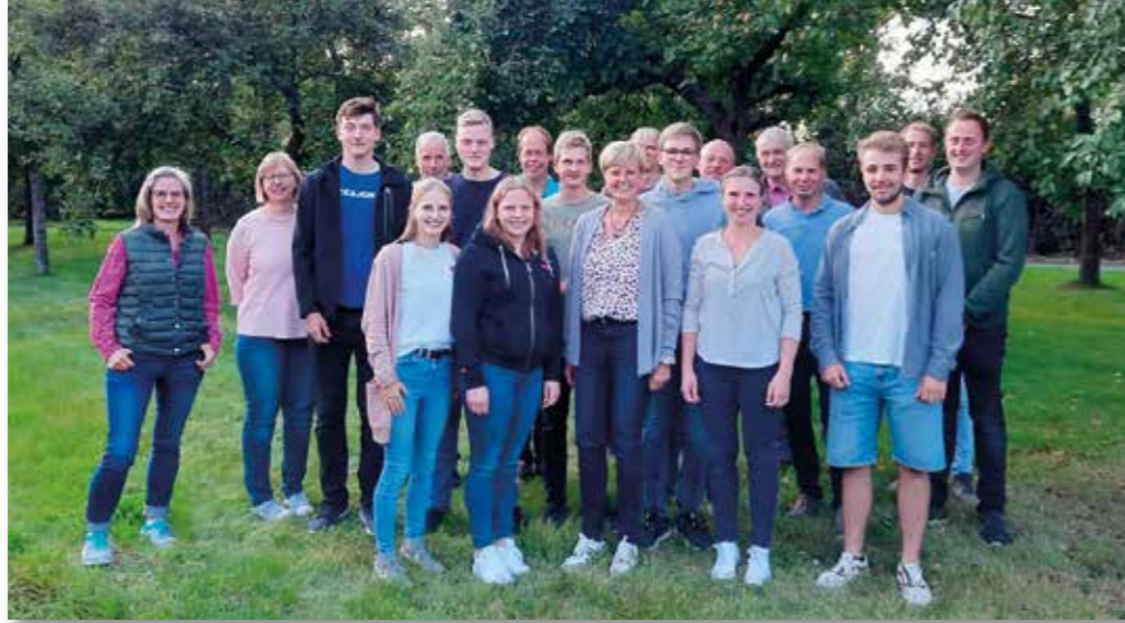
Die Ausbilder mit ihren neuen Azubis in der Landwirtschaft auf dem Hof Kreickmann, Buddenbaum (vier Auszubildende waren leider verhindert).

Auf dem Milchviehbetrieb Kreickmann, mit Boxenlaufstall und Melkroboter steht