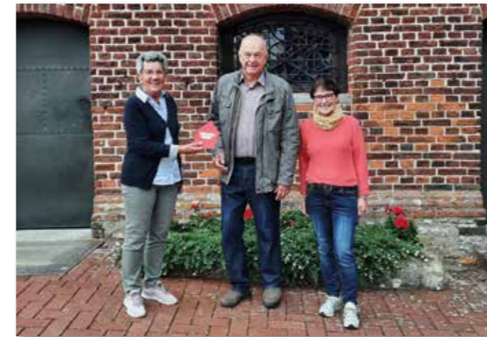
Spendenübergabe an die Kapellengemeinde Buddenbaum.

Kleiderspende wird sortiert, auf Schäden geprüft und zum Teil sogar privat von den Ehrenamtlichen HelferInnen gewaschen und gebügelt, bevor sie in die Regale eingeräumt werden. Längst nicht alles kann in unserem Lädchen einen Platz finden. Vieles wird direkt als Spende an den Kleinen Prinzen weitergereicht.