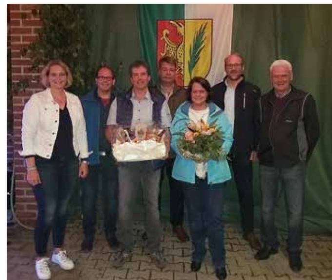
... und bei der Ehrung des Silberkönigspaares.

ben schönen Erinnerungen, was vor 50 und 25 Jahren so passiert ist, werden auch Neuerungen und Änderungen der letzten Jahre angesprochen. Wer dieses Video noch nicht gesehen hat, kann es sich auf der Homepage des Schützen- und Heimatvereins noch anschauen. Viel Spaß dabei!