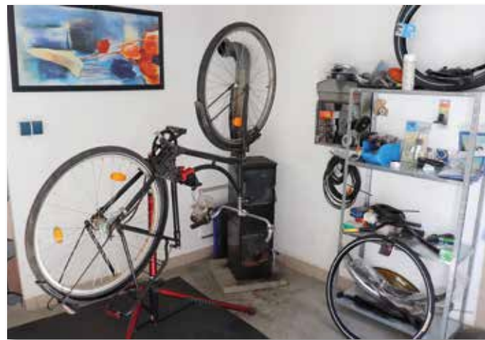
In den ehemaligen Stallungen des Leutehauses werden kaputte Drahtesel wieder auf Vordermann gebracht.

Übrigens arbeitet die Hoetmarer Fahrradwerkstatt, deren Einrichtung im Jahr 2018 wesentlich durch das Programm „500 Land Initiativen“ des Bundesministeriums für Ernährung und Landwirtschaft finanziert wurde, bis heute nicht kommerziell. „Alle Einnahmen gehen in den Kauf von Er-