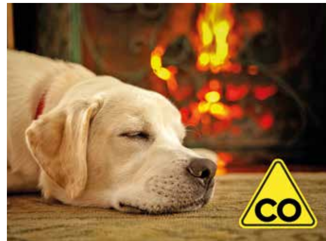
Kohlenmonoxid (CO) ist besonders gefährlich, da es unsichtbar und geruchlos ist. Auch die beste Spürnase kann es nicht wahrnehmen.