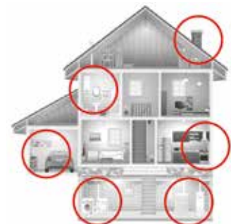
Im Eigenheim befinden sich verschiedene potenzielle Kohlenmonoxid-Gefahrenquellen.

die unsichtbare Gefahr. Die Geräte sollten in allen Haushalten installiert werden, wo es zu einer unvollständigen Verbrennung kohlenstoffhaltiger Materialien kommen kann. Zu potenziellen Gefahrenquellen zählen neben Kaminen auch Kohleöfen, Gasthermen oder andere Heizungsanlagen.