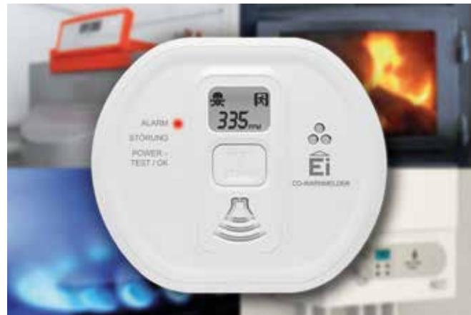
Kohlenmonoxidmelder zeigen nicht nur die gemessene CO-Konzentration an, sondern auch, ob man lüften oder die Wohnung verlassen sollte.

Nicht umsonst ist eine regelmäßige Kontrolle des Kaminofens durch den Schornsteinfeger Pflicht. Doch zwischen diesen Prüfintervallen können unerwartete Mängel auftreten. Schon ein Vogelneest, das den Schornstein verstopft, verhindert das Abziehen des giftigen Gases, das sich in der Folge unbemerkt verbreitet. Mit einem lauten Warnton stellt ein CO-Melder sicher, dass anwesende Personen rechtzeitig den Raum verlassen können, bevor es zu einer ernstesten Gefahrensituation kommt. Das Gerät ist mit einem elektrochemischen Sensor ausgestattet und kontrolliert alle vier Sekunden den CO-Gehalt der Umgebungsluft. Besonders praktisch sind Modelle mit digi-