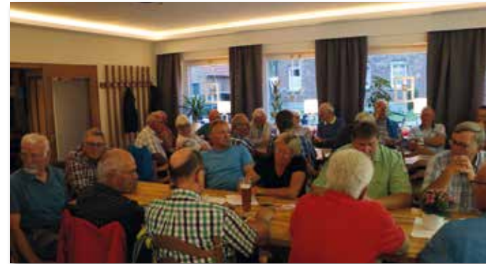
Die Mitgliederversammlung des Bürgerbusvereins für das abgelaufene Jahr 2020 war gut besucht.

Herausragendes Ereignis war das 10-jährige Fahrjubiläum, welches noch vor der Coronapandemie am 8. März 2020 im Feuerwehrgerätehaus mit zahlreichen Hoetmarer Bürgerinnen und Bürgern sowie den befreundeten Bürgerbusvereinen aus dem Kreis Warendorf und der Stadt Ascheberg sowie einigen Offiziellen gefeiert werden konnte. Es war die letzte größere Veranstaltung vor der Pandemie in Hoetmar.