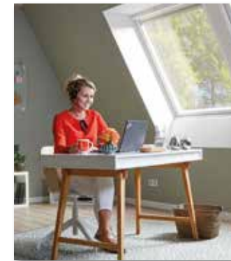
Das Dachgeschoss bietet mit viel Tageslicht optimale Voraussetzungen für ein Arbeitszimmer und schafft eine räumliche Trennung zwischen Arbeit und Privatleben.

(djd). Viele Menschen verbringen heute einen Großteil ihrer Arbeitszeit im Homeoffice. Ständiges Improvisieren mit wechselnden Arbeitsplätzen kann allerdings