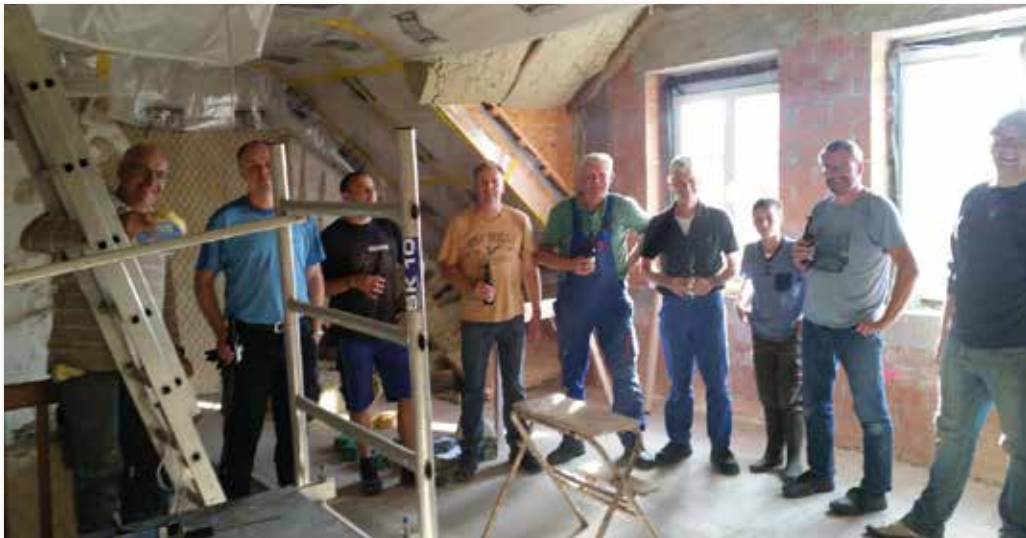
Die wohlverdiente Stärkung bei der Dämmung des Dachgeschosses – weitere Arbeitsschritte wollen genau geplant und diskutiert sein.

Wie bereits in vergangenen Ausgaben des Dorfmagazins berichtet, wurde das Leutehaus in Eigenleistung von den Heimatfreunden kernsaniert und renoviert. Von Anfang an waren auch Vertreter des SC mit von der Partie und halfen neben den Abbrucharbeiten auch bei der Dämmung der Fassade, der Deckenverkleidung und dem Ausbau des Dachgeschosses. Im Endspurt für den Innenausbau legten sich dann unsere Mitglieder besonders ins Zeug: Trockene-strich und Verspachtelungen im Dachgeschoss sowie Tapezieren und Fliesen des Erdgeschosses erfolgte in Eigenleistung.