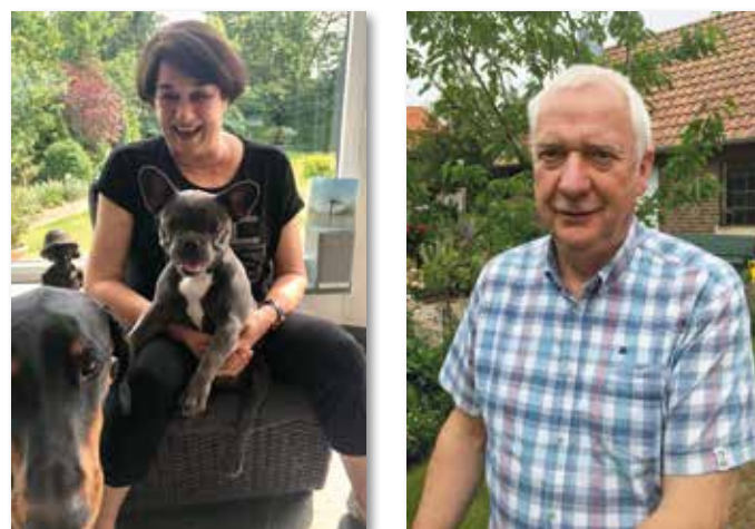
liebevolles, glückliches und gesundes neues Jahr.

Lassen wir nun das alte Jahr mit seinem Sonnenschein und seinen Wolken hinter uns und umarmen das uns freundlich und strahlend anblickende neue Jahr 2022. Wir wünschen allen Hoet-marer Mitbürgern/Mitbür-gerinnen von Herzen ein