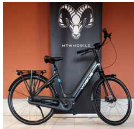
Modell „Excellent“ 2.399 €