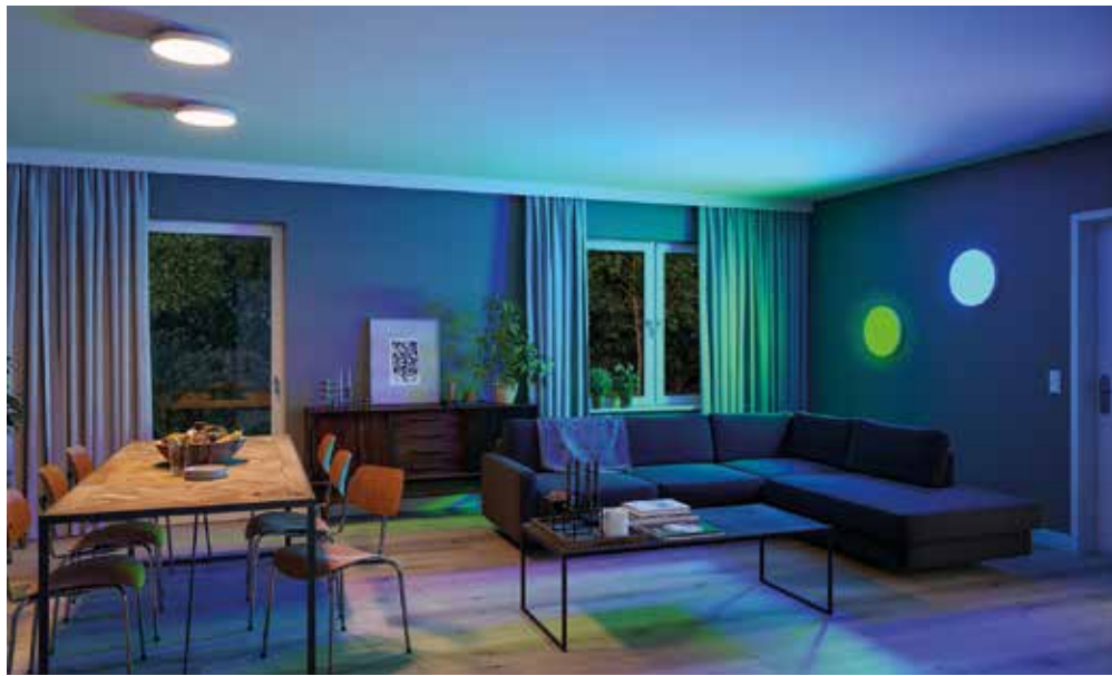
Das Zusammenspiel verschiedener Lichtquellen bringt eine behagliche Atmosphäre in den Wohnraum.

Eine gleichmäßige und blendfreie Grundbeleuchtung bildet dabei nur den ersten Schritt. Um dem Raum eine gemütliche Ausstrahlung zu verleihen, bietet sich die Kombination mehrerer Lichtquellen an. „Das können fünf und mehr Leuchten sein,