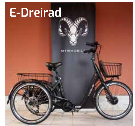
E-Dreirad Modell „Tri-Velo“ 2.599 €