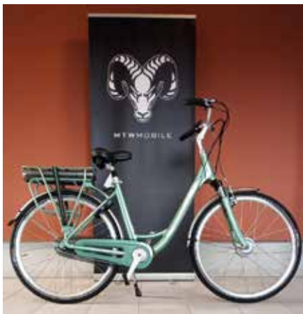
Modell „Basic“ 1.450 €