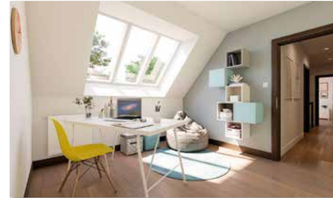
Mehr Tageslicht im Homeoffice: Mit verschiedenen Maßnahmen lässt sich der Arbeitsplatz im eigenen Zuhause attraktiver gestalten.

Das Dachgeschoss für die konsequente Trennung von Arbeit und Privatleben nutzen