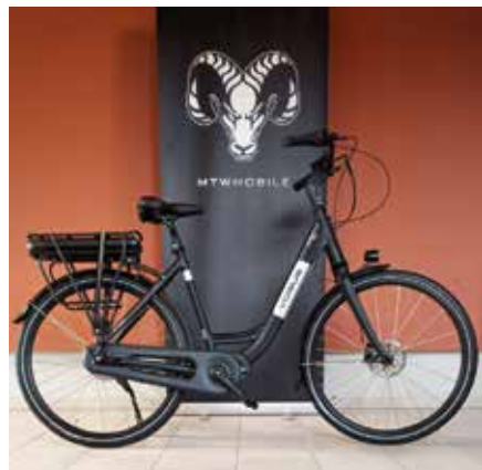
Modell „Infinity“ 1.980 €