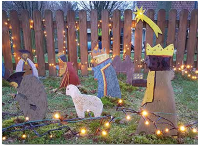
Krippe an der Stellmacherei.

Das Motto der Sternsingeraktion in diesem Jahr lautet „Gesund werden – Gesund Bleiben. Ein Kinderrecht weltweit“. Damit machen die Sternsinger auf die Gesundheitsversorgung von Mädchen und Jungen in Afrika aufmerksam, die in vielen Ländern des Globalen Südens aufgrund schwacher Gesundheitssysteme und fehlender sozialer Sicherung stark gefährdet ist. Die jährlichen Segenaufkleber werden in den Gottesdiensten am Dreikönigstag gesegnet und liegen anschließend mit weiteren Informationen zur