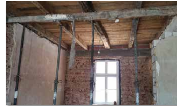
Der Vorher-Nachher-Vergleich zeigt eine mehr als kosmetische Aufwertung der Räume.