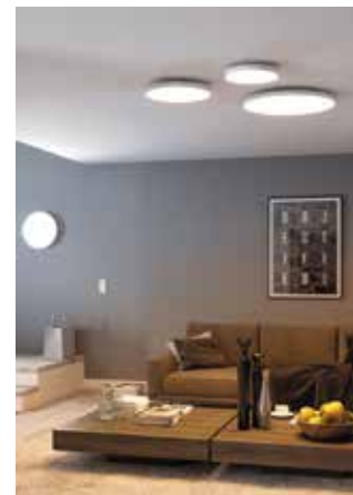
LED-Leuchten verbinden geringen Energieverbrauch mit viel Flexibilität bei der eigenen Lichtplanung.

unter anderem für den Essbereich, die Lesecke und das Sofa. Wichtig ist es, auf behagliches warmweißes Licht zu achten“, empfiehlt Jessika Tilsner vom Hersteller Paulmann Licht. Moderne Lampen und Leuchten bieten zudem Flexibilität, vom Dimmen bis zu Anpassungen der Lichtfarbe. Schon bei der Planung ist zu überlegen, welche Bereiche des Wohnzimmers wie genutzt werden. Für die Beleuchtung der Lesecke bietet sich zum Beispiel eine Stehleuchte an. „Sie sollte über direktes blendfreies Licht verfügen, das man direkt auf das Buch ausrichten kann“, führt die Lichtexpertin aus. Eine Alternative – gerade bei wenig Platz – sind Wandleslampen.