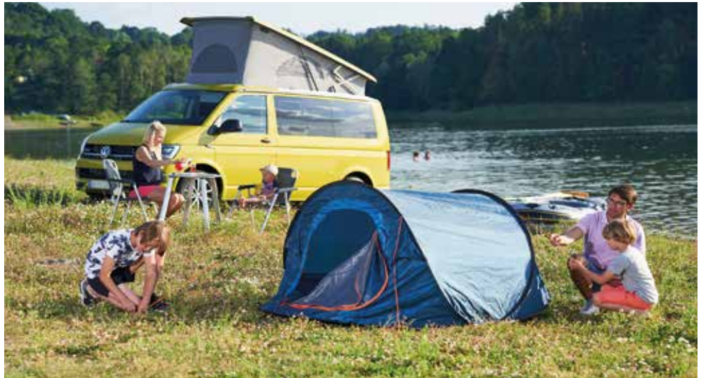
Familienfreundliche Campingplätze warten an der Talsperre Pöhl und zahlreichen weiteren Stauseen im Vogtland.

(djd). Am Morgen mit Vogelgezwitscher aufwachen und frühstücken mit Blick auf glitzernes Wasser. Dann eine Runde wandern oder Rad fahren und am Nachmittag direkt vor der Haustür schwimmen oder Boot fahren. So könnte ein perfekter Ferientag im Vogtland aussehen, zum Beispiel an der Talsperre Pöhl bei Plauen. Das Vogtländische Meer ist nur einer von zahlreichen glasklaren Stauseen in der grünen Grenzregion von Sachsen und Thüringen. Am Ufer lädt ein familienfreundlicher Campingplatz zur naturnahen Übernachtung ein, genau wie an vielen anderen ruhig gelegenen Orten in der idyllischen Mittelgebirgsregion. Auf den Campingplätzen gibt es meist auch Mietunterkünfte, daneben Ferienwohnungen und