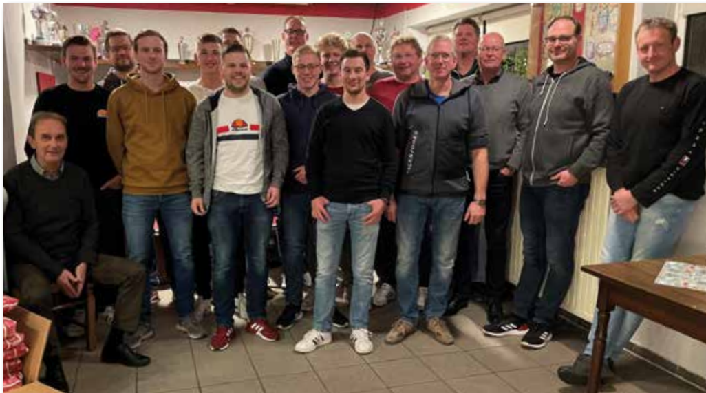
Ein großer Dank geht an den Trainerstab des Jugendfußballs im SC Hoetmar.

hen ein Unentschieden und acht Niederlagen.