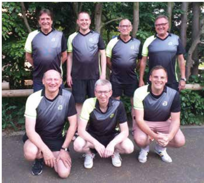
Die 1.-2. Mannschaft.