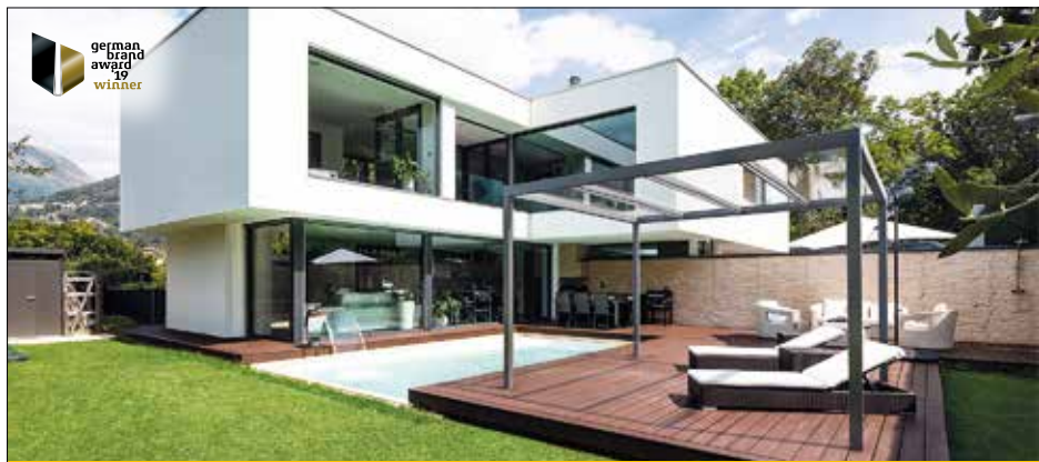
VERANDACUBE: DAS EINZIGE ECHTE FLACHDACH