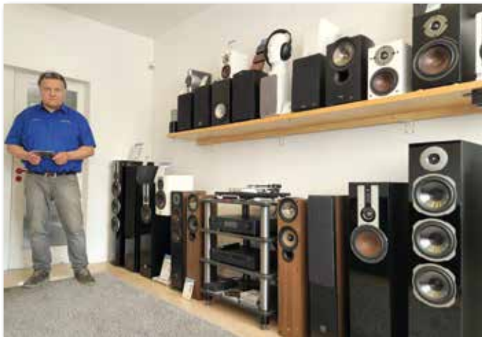
Der passionierte Hifi-Spezialist bietet in seinem Geschäft auch Lautsprechertests an.