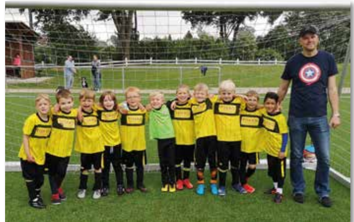
Mannschaftsfoto der Minis.