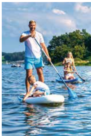
An der Talsperre Pöhl können Wasserratten Stand-up-Paddling, segeln und surfen lernen.