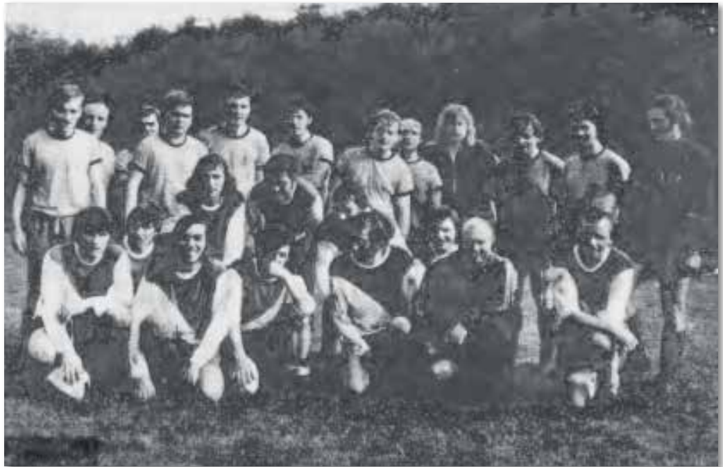
Eine der ersten Mannschaften (1974):

Der eigentliche Gedanke war aber, die spielfreie Zeit vor der Saison – adäquate Gegner in der Nachbarschaft des Dorfes fehlten damals (wie heute) – zu nutzen. Ursprünglich ging es dann auch nur um ein Fußballspiel – die Spieler der ersten und zweiten Mannschaft des SCs sollten gegeneinander antreten – Kicker nördlich des Wiener Baches gegen die Fußballer südlich des Wiener Baches. Und der Termin war auch nicht Pfingsten (diese Festlegung erfolgte wohl erst ab dem dritten Jahr, weil Pfingsten