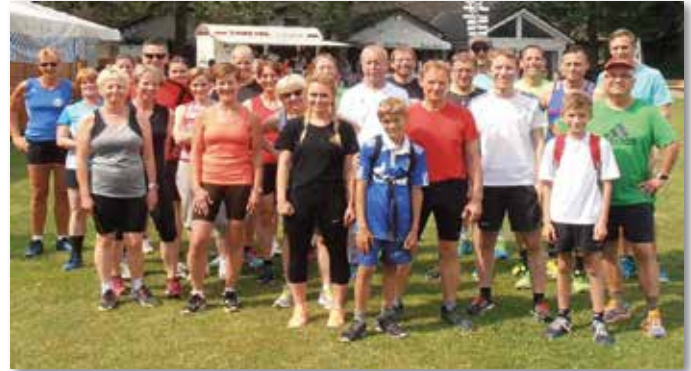
Teilnehmerinnen und Teilnehmer des letzten Nillaufes.