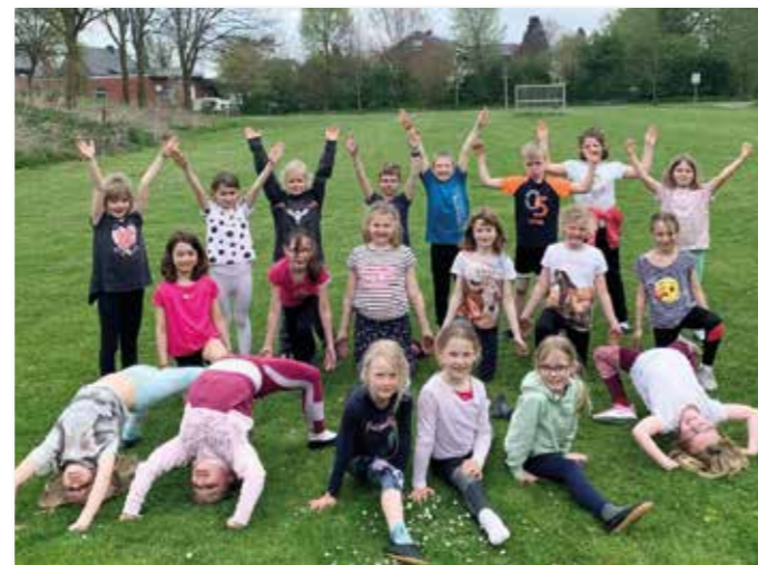
Tanzgruppe der 2. Klasse