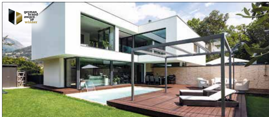
VERANDACUBE: DAS EINZIGE ECHTE FLACHDACH