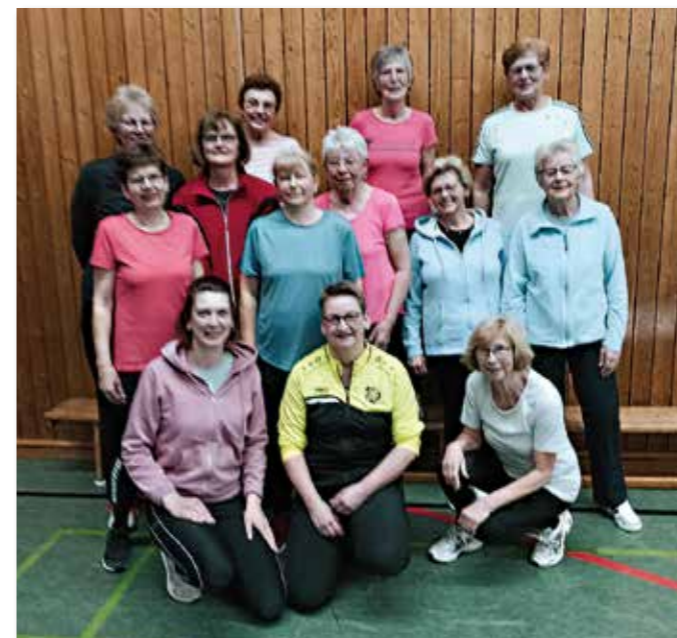
„Fit ab 50“-Gruppe

SC-Bambinis Wir sind die SC-Bambinis – auch als Eltern-Kind-Turnen bekannt – und die jüngsten