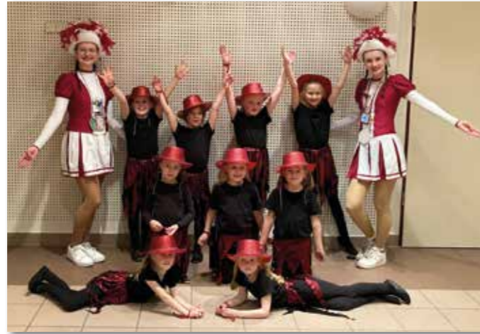
Tanzgruppe der 1. Klasse

Wir sind die Tanzgruppe der 1. Klasse und freuen uns in diesem Jahr über unsere allerersten Auftritte. Im letzten Sommer sind wir in die