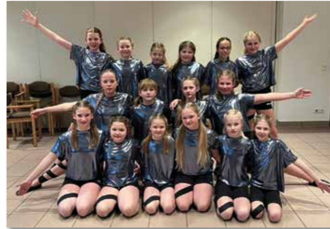
Tanzgruppe der 5. und 6. Klasse