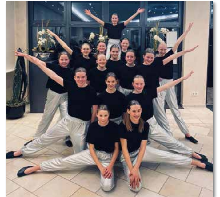
Tanzgruppe der 7. und 8. Klasse

Wir sind die Tanzgruppe des 9. Schuljahres. Unsere Gruppe besteht aus acht Tänzerinnen, die von Helen und