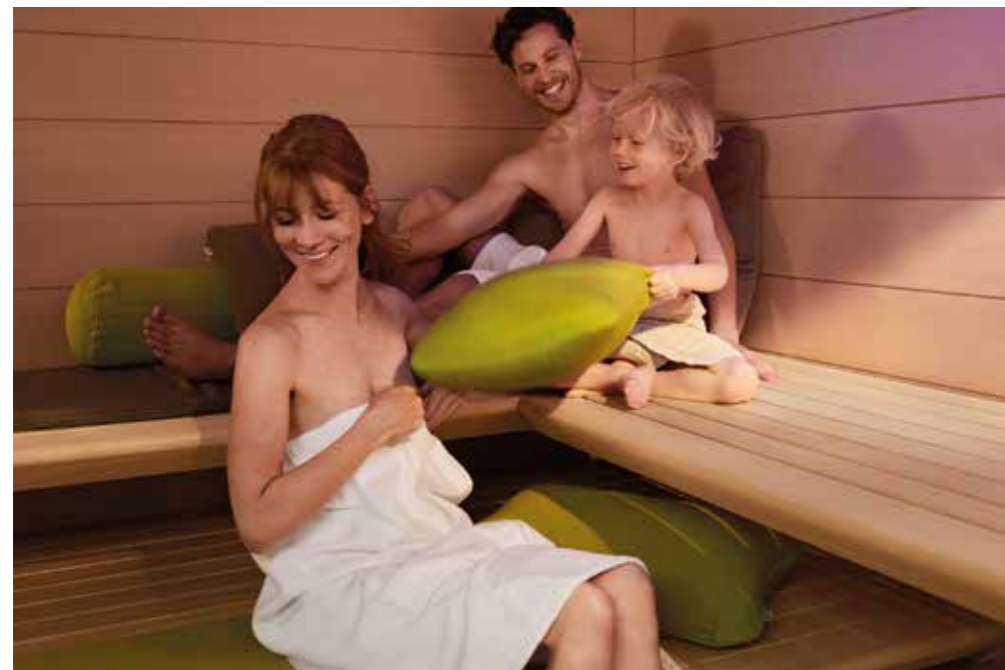
Die ganze Familie freut sich über wohltuende Wärme, in der man entspannen und regenerieren kann.

eine bessere Schlafqualität und für Haut und Atemwege sind regelmäßige Saunagänge eine Wohltat. So wird die Haut gereinigt und mit wichtigen Nähr- und Mineralstoffen versorgt. Das Sanarium von Klafs beispielsweise vereint die positiven Wirkungen von Sauna und Dampfbad miteinander, aus einer einzigen Badeform kann man fünf Badeformen mit wechselnder Luftfeuchtigkeit kreieren. Mehr Infos gibt es unter www.klafs.de . Das sorgt nicht nur für Abwechslung, sondern hat auch einen weiteren gesundheitlichen Nutzen: Regelmäßiges Saunabaden kann Bluthochdruck entgegenwirken.