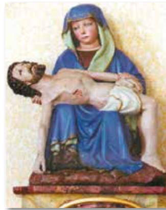
Marienbild der „Mutter vom Guten Rat“ aus der Zeit um 1450.

Gemeinschaft – mit all ihren Sorgen und Ängsten, aber auch mit Ihren Freuden und Ihrem Glück auf den Weg zur Kapelle in Buddenbaum, zur „Mutter vom Guten Rat“ zu machen.