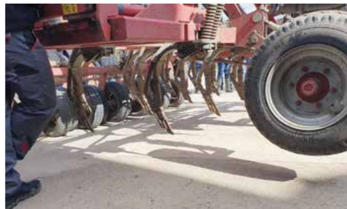
Die Sämaschine ist eine Direktsaatmaschine, womit ohne vorherige Bodenbearbeitung gesät werden kann.

20-fache des Humusgewichtes erreichen. Dazu kommt noch, dass der Humus die für die Pflanzenernährung wichtigen Anionen und Kationen austauschbar binden kann und so vor Auswaschung schützt. Ein wichtiges Thema im Bezug auf Düngereffizienz.