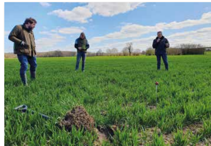
Bei dem Wurzelballen auf dem Foto handelt es sich um Winterweizen.

allen Landwirten noch Tipps zu weiteren Bestandsführten zu sehen, dabei hat dieses System durchaus Vorteile.