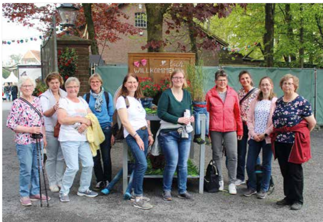
Ein Highlight im Mai war die Halbtagesfahrt zum Waldgartenmarkt auf dem Landgut Krumme in Velen am Samstag, 6. Mai 2023, unter dem Motto „Glück lässt sich pflanzen“.

Mit privaten PKW steuerten wir zuerst den Hof Erdmann an. Das Betriebsleiterpaar begrüßte uns herzlich und so war die Biogasanlage, welche auch das Gaßbachtal Freibad erwärmt, unser erstes Ziel der näheren Betrachtung. Des Weiteren baut die Familie schon seit mindestens 150 Jahren Obst für den heimischen Markt an. Pflaumen, Zwetschgen, Mirabellen, Bir-