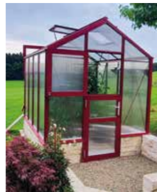
Eine gute Lüftung ist wichtig, damit Obst und Gemüse im Gewächshaus gedeihen kann.

Für kleinere Gärten oder Höfe, wo die Grundfläche für ein großes Gewächshaus nicht reicht, sind sogenannte Tomatenhäuser zu empfehlen. Besonders schmal in der Anlehn-Variante oder auch freistehend wachsen darin natürlich auch andere Gemüsesorten. Für heimische Pflanzen wie Salate, Tomaten und Gurken empfiehlt Christoph Mauden eine Verglasung ohne UV-Durchlässigkeit: „Diese Pflanzen können ansonsten leicht verbrennen.“ Dass sie dennoch auf Dauer genug Sonnenlicht bekommen, liegt auch an einer verringerten Kondensatbildung: „Durch ein ausgeglichenes Testverfahren ist es uns gelungen, die Bildung von Grünbelag innerhalb der Stegplatten nahezu vollständig zu verhindern. Daher haben sie auch nach Jahren noch eine hohe Lichtdurchlässigkeit.“