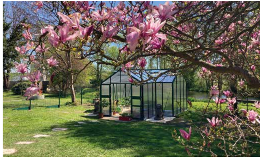
Wenn im Frühjahr die Magnolien blühen, fängt im Gewächshaus schon die Erntezeit an.