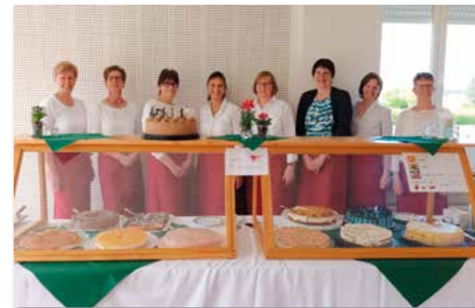
Ein weiterer Höhepunkt der Landfrauen war das von unseren Mitgliedern bestückte große Kuchenbuffet im Pfarrheim zum Sattelfest und Maibaumaufstellen am 30. April 2023. Beim Schulfest zur 25-Jahres-Feier des Fördervereins der Grundschule am 12. Mai 2023 wurde die Bewirtung des Cafés in der Aula von uns Landfrauen und der kfd Hoetmar übernommen.