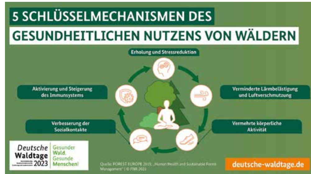
Fünf Schlüsselmechanismen des gesundheitlichen Nutzens von Wald.

(DJD). Bewegung in der Natur und alltägliche Sorgen hinter sich lassen: Der Wald ist für viele Menschen ein wichtiger Erholungs- und Freizeitort. Mehr als zwei Drittel der Deutschen gehen mindestens einmal pro Monat in den Wald. Diese Waldbesuche dauern durchschnittlich knapp zwei Stunden und werden vor allem für körperliche Aktivitäten genutzt. Zu diesen Ergebnissen kam eine Befragung im Auftrag des Bundesministeriums für Ernährung und Landwirtschaft (BMEL). Wälder tragen darüber hinaus auf vielfältige Weise zur Gesundheit der Menschen bei. Sie liefern nicht nur saubere Luft, frisches Trinkwasser, gesunde Lebensmittel und Heilpflanzen. Waldbesuche wirken sich außerdem positiv auf die körperliche, geistige und soziale Gesundheit aus. Das