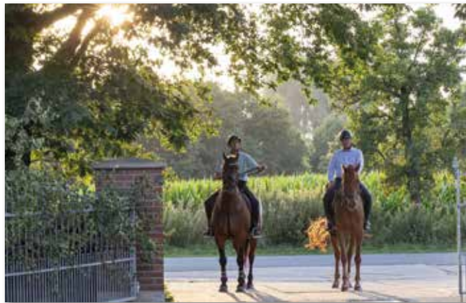
König Martin sprang zu Pferde ein, als es hieß: Üben beim König! Zum Üben selbst waren rund 100 Gardisten gekommen.