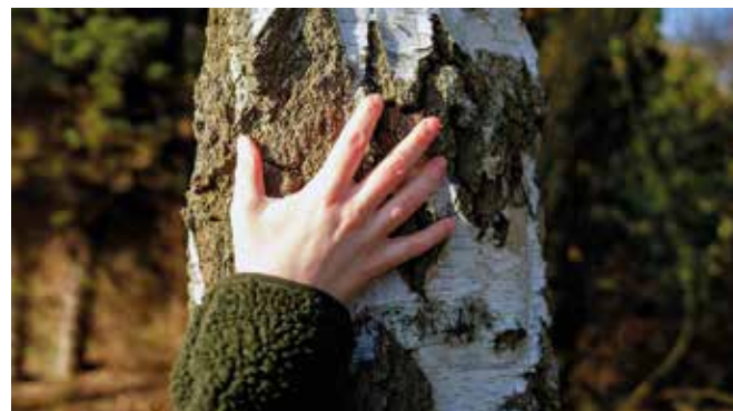
„Gesunder Wald. Gesunde Menschen!“, so lautet das Motto der Deutschen Waldtage 2023.

ziehen der Atmosphäre Kohlendioxid (CO 2 ) und produzieren Holz und Sauerstoff. Allein die deutschen Waldgebiete binden jährlich rund 56 Millionen Tonnen CO 2 . Verstärkt wird das durch die Speicherung in langlebigen Holzprodukten. Hier werden noch einmal sechs Millionen Tonnen Kohlendioxid pro Jahr