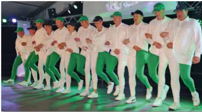
Die Landfrauen und der Landwirtschaftliche Ortsverein schwangen im wahrsten Sinne des Wortes das Tanzbein.