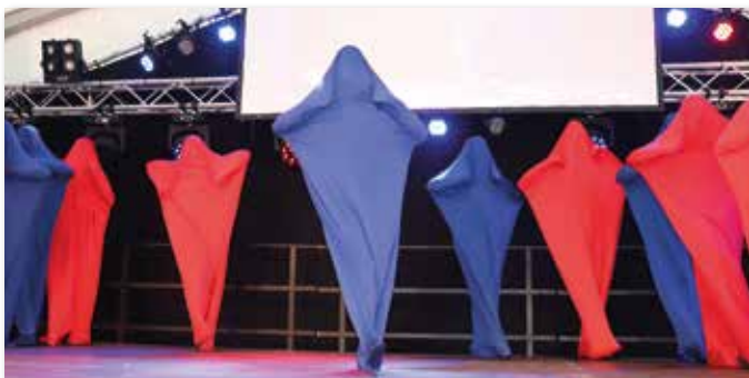
Die Damen- und Ehrengarde zeigte einen Tanz im Sack und kam unter den Kostümen mächtig ins Schwitzen.