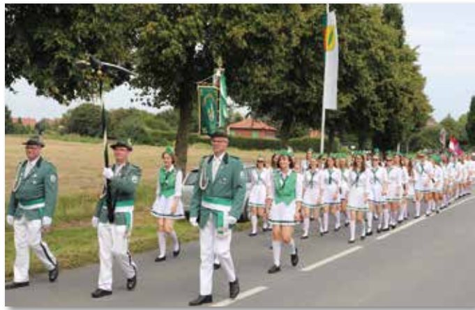
Seit mehr als einem halben Jahrhundert sind die Damen aus dem Schützen- und Heimatverein nicht mehr wegzudenken.