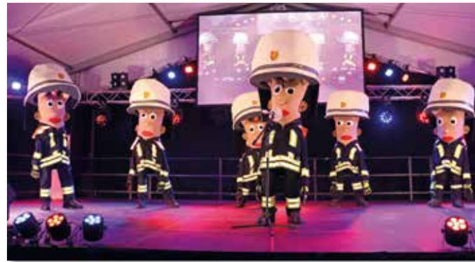
Zugabe-Rufe gab es für die singenden Kameraden der Freiwilligen Feuerwehr.