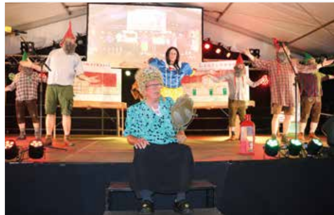
Schneewittchen und die heimatfreundlichen Zwerge bewiesen, dass die Heimatfreunde die besten Baumeister des Dorfes sind.