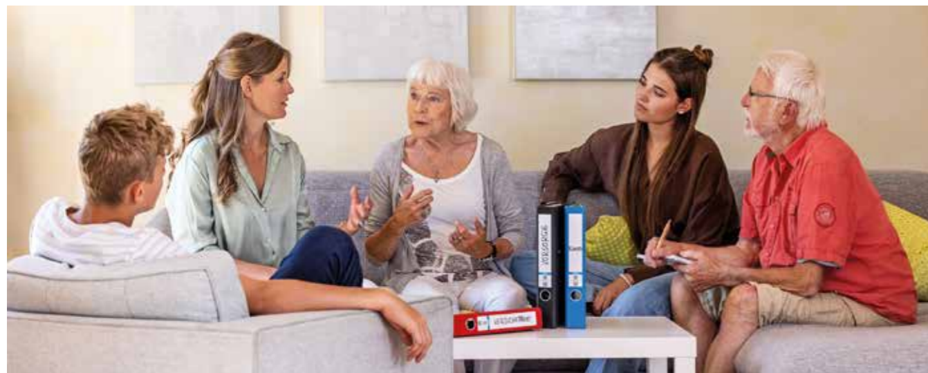
Miteinander zu sprechen, ist ein guter Anfang: Schwierige Themen wie Krankheit und Tod sollten offen im Familienkreis diskutiert werden. Mit Vollmachten und Verfügungen lassen sich viele Dinge für den Ernstfall regeln.