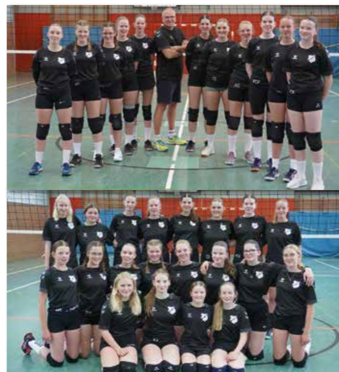
Auf den Fotos sind die Spielerinnen und Trainer mit den neuen Trikots zu sehen. Ein großer Dank geht an das Sponsorenteam! Erstmals sind die Trikots aller Mannschaften der Abteilung einheitlich, super!

Mit OSKAR endlich wieder den Fernseher verstehen.