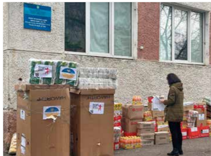
Soziales Rehabilitations Center II.

werden, liegen wieder konkrete Bedarfslisten vor. Im Iwano-Frankiwsk-Zentrum für soziale und psychologi-