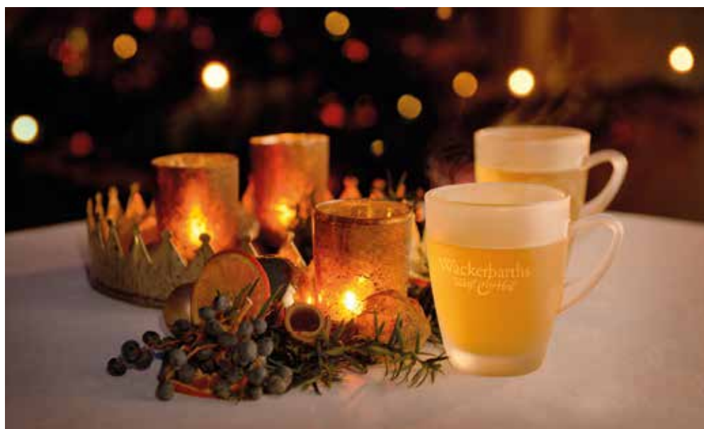
Egal, ob rot oder weiß: Gewürzter Wein wärmt seit Jahrhunderten die Herzen.

In einer Rezeptesammlung im Nachlass des Raugrafen von Wackerbarth entdeckten Historiker einen besonderen Schatz: das älteste bekannte Glühweinrezept Deutschlands.