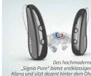
Das hochmoderne „Signia Pure“ bietet erstklassigen Klang und sitzt dezent hinter dem Ohr