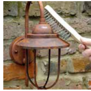
Für eine optimale Haftung des Metallschutz-Lackes sollten die Oberflächen gründlich gereinigt und von losem Rost befreit werden.

Beim Streichen mit Metallschutz-Lack sollten Heimwerker einige Punkte beachten, um eine gute Haftung und zuverlässigen Rostschutz sicherzustellen. Tipps zur richtigen Verarbeitung sind auf www.hammerite.de nachlesbar. So sollte die Verarbeitung am besten bei mildem, trockenem Wetter erfolgen, die ideale Außentemperatur liegt zwischen 10 und 21 Grad Celsius. Alle Oberflächen werden vor dem Lackieren gründlich von losem Rost, alter Farbe und anderen Verunreinigungen befreit. An sehr stark verrosteten Stellen