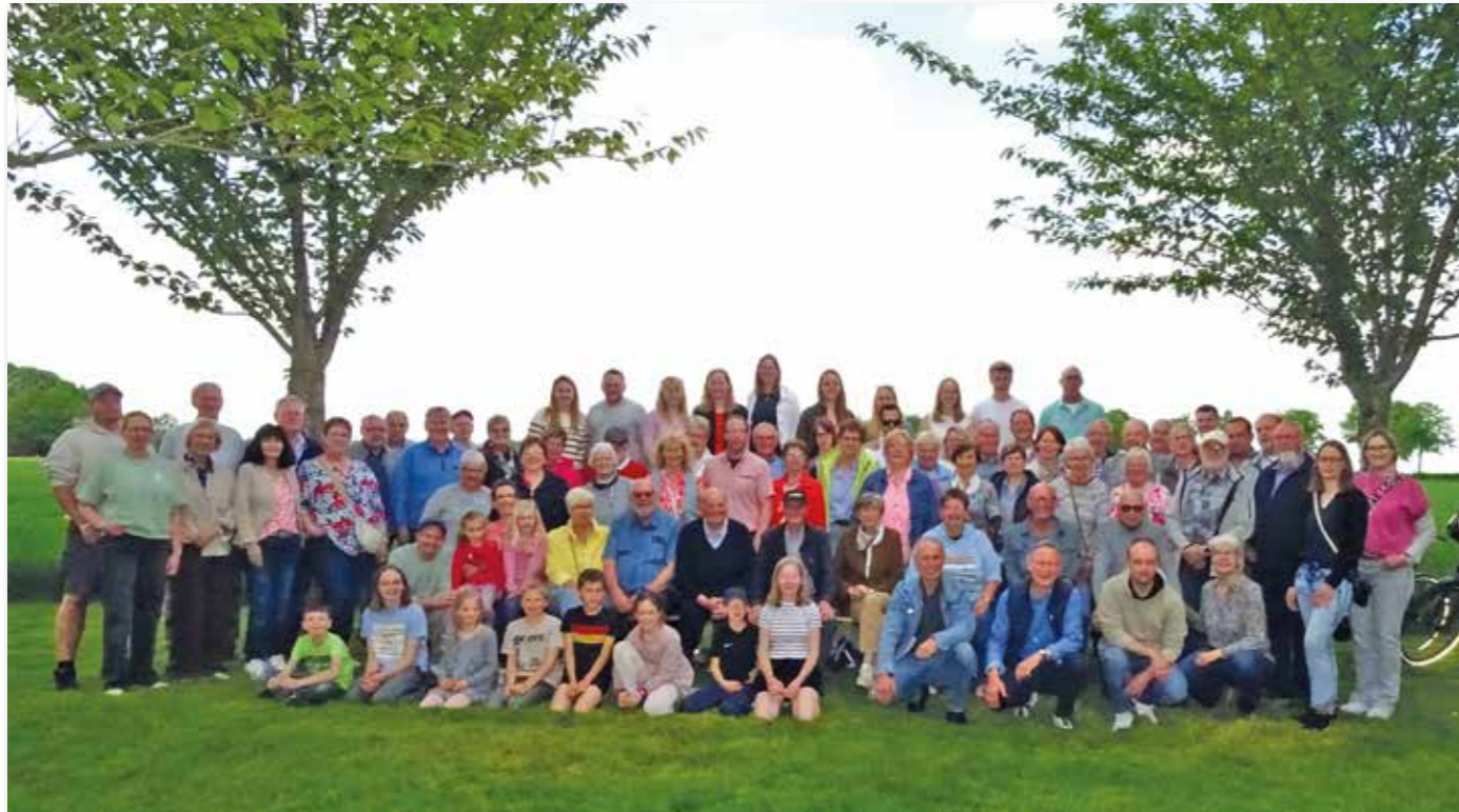
Gruppenfoto am Nachmittag.

Mit gerade mal 17 Häusern, die der Bauerschaft zugeordnet werden, gehört die Bauerschaft Mestrup zu den kleinen Bauerschaften in Hoetmar. Dafür werden die Pflege der Gemeinschaft und des Miteinanders hier besonders großgeschrieben.