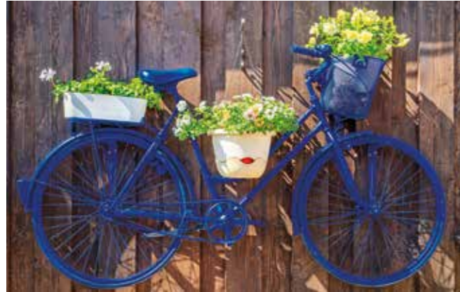
Kreatives Upcycling: Selbst ein ausgedientes Fahrrad bekommt durch einen Metallschutz-Lack ein zweites Leben und wird zum außergewöhnlichen Hingucker.

oder ungewöhnliches Pflanzregal. In einer auffälligen Farbe oder mit einer besonderen Struktur gestrichen, zum Beispiel in der neuen Hammerite Ultima Sandstruktur, zieht diese ungewöhnliche Gartendeko garantiert bewundernde Blicke auf sich.