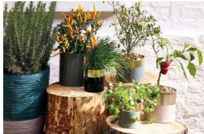
Alte Konservendosen werden ohne viel Aufwand zu individuellen Pflanzbehältern.

kann es erforderlich sein, vor dem Lackieren einen Rostblocker, -umwandler oder eine Rostgrundierung aufzutragen. Wichtig ist weiterhin ein gleichmäßiges Auftragen des Lackes mit Pinsel oder Rolle. Mehrere dünne Schichten halten dabei in der Regel besser als eine dicke. Jede Farbschicht muss man ausreichend trocknen lassen – Informationen zu den Trocknungszeiten des Lackes sind auf der Dose angegeben.