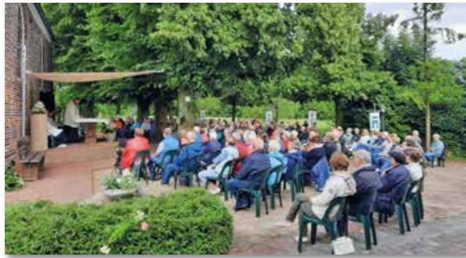
Gottesdienst an der Wallfahrtskapelle Buddenbaum.

Rund um das Fest Maria Heimsuchung findet auch in diesem Jahr die Wallfahrtswoche in Buddenbaum statt. Am Sonntag, dem 28. Juni, beginnt die Woche mit der Prozession von Hoetmar nach