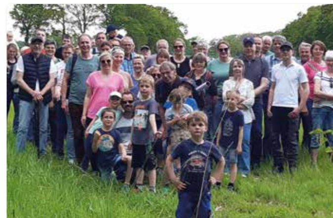
Gruppenfoto am Mussenbach.

Ein Schnadgang ist eine Grenzbegehung, die in früheren Jahrhunderten dazu diente, Grenzstreitigkeiten zu vermeiden. Wenn Grenzzeichen verschwunden waren, wurde versucht diese wiederherzustellen, indem man Zeichen in Bäume schnitt oder Schnad-(Grenz-)steine setzte. Mit der Teilung der Marken, der Verkopplung der Grundstücke und mit der Aufstellung des Grundsteuerkatasters verloren Schnadgänge ihre Notwendigkeit und ihre Bedeutung und dienen heute eher der Information, der Pflege der Gemeinschaft und der Bewegung in der Natur.