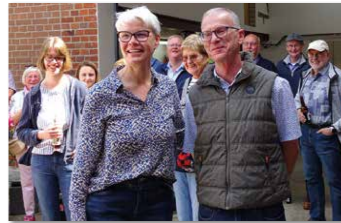
Dank an die Gastgeber.

werden. Zu allen freudigen Ereignissen (Geburt/Hochzeit/runder Geburtstag) stellen die Nachbarn die eigens angefertigte Bauerschaftsfahne auf.